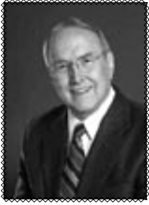
Д-Р Д. ДОБСОН